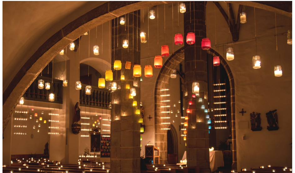
„Nacht der 1.000 Lichter“ im Vorjahr.

Donnerstag, 31. Oktober , 19:00 Uhr: „Nacht der 1.000 Lichter“ mit der Jugendtankstelle