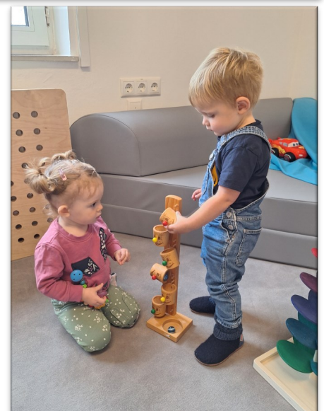
Die Kinder haben große Freude beim gemeinsamen Spielen.

Auf zahlreichen Besuch freut sich die Gemeinde und das Team der Pfarrcaritas.